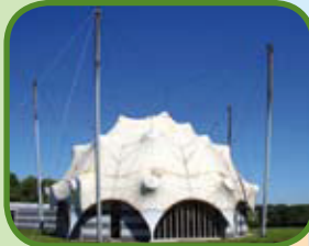
Nationaal Bevrijdingsmuseum 1944-1945

Heeft u op- of aanmerkingen over de bewegwijzering, de route of de bijbehorende fietsroutekaart, dan kunt u contact opnemen met het routebureau van het Regionaal Bureau voor Toerisme KAN via lekkerfietsen.nl en T.0900-6070803 (15 cpm).