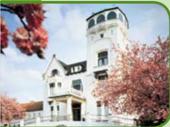
Jachtslot de Mookerheide